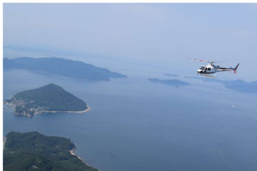
▲今回実証イメージ ※小豆島へ向かうヘリコプター