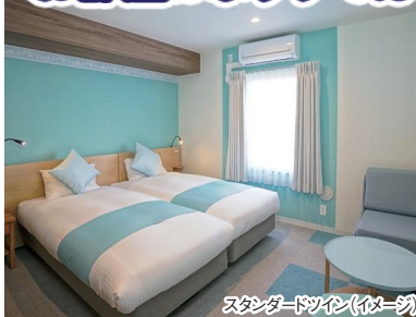
スタンダードツイン(イメージ)