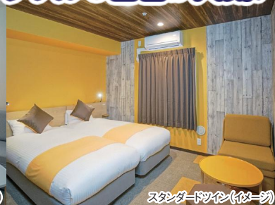
スタンダードツイン(イメージ)