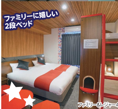
ファミリーに嬉しい 2段ベッド