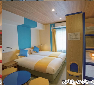
ファミリー&レジャー4