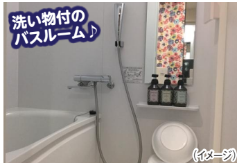
洗い物付の バスルーム♪