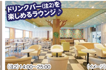
ドリンクバー(注2)を 楽しめるラウンジ♪