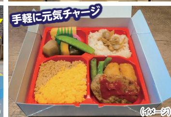
手軽に元気チャージ♪