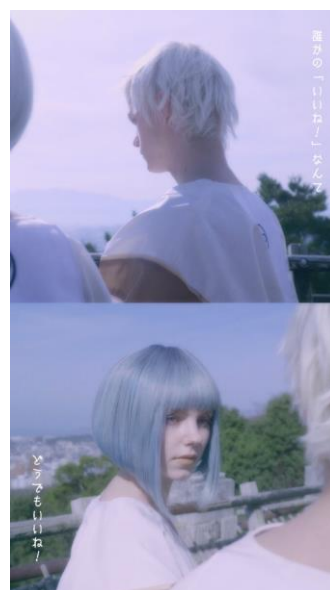
「NEOHENRO | 四国ネオ遍路(逆打ち ver.)」“謎の言葉”のシーン

また、逆再生によって「NEOHENRO」88箇所目から1箇所目に向けてプレイバックする中に、登場人物2人のメイキングシーンが随所に紹介されます。第1弾の「NEOHENRO | 四国ネオ遍路(順打ち ver.)」では決して見ることでできなかった2人の笑顔にあふれるオフショットの数々を経て、今回の動画テーマである「思い出映えの四国巡り」が最後にテロップで現れます。