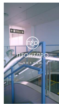
「NEOHENRO | 四国ネオ遍路 (逆打ち ver.)」より