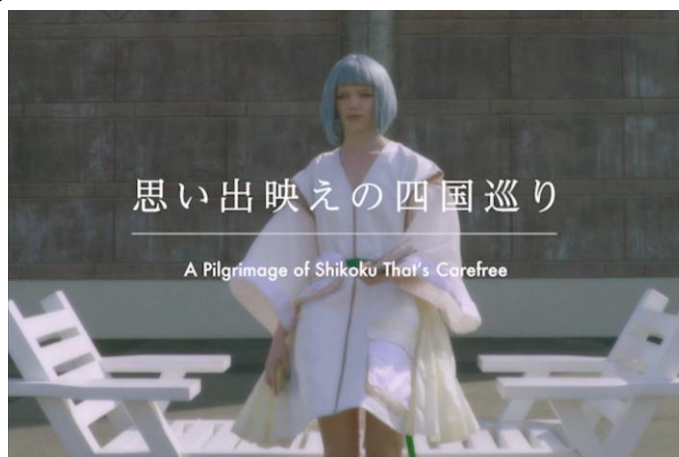
「NEOHENRO | 四国ネオ遍路 (逆打ち ver.)」カット

第2弾となる新ムービー「NEOHENRO | 四国ネオ遍路 (逆打ち ver.)」は、実際のお遍路を逆順に回る「逆打ち」になぞらえて、インスタ映えではなく、“思い出映えの四国巡り”をテーマに、第1弾の「NEOHENRO | 四国ネオ遍路(順打ち ver.)」の逆再生した映像にメイキングシーンを織り交ぜたもので、四国の魅力を斬新に表現しています。