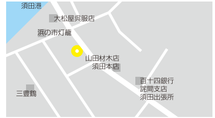
●コミュニティバス須田バス停