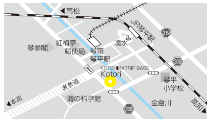
●KOTOHIRA TRIP BASE -Kotori-(表参道入口すぐ)※1/1~1/3は乗降不可